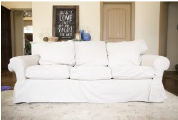
Quasi uguale a quello dell'Avanella

insaputa, ma bisogna pure arrangiarsi. Il catalogo Ikea incarna quello che rappresentava il catalogo Postalmaket nella mia infanzia: in pratica guardi tutto, vorresti comprare tutto, e poi non compri nulla. O, in alternativa, vai in fissa, guidi fino all'Ikea, perlustri per ore e poi ti accorgi di non riuscire nemmeno a sollevare dagli scaffali quello che vorresti caricarti in macchina e portarti in casa.