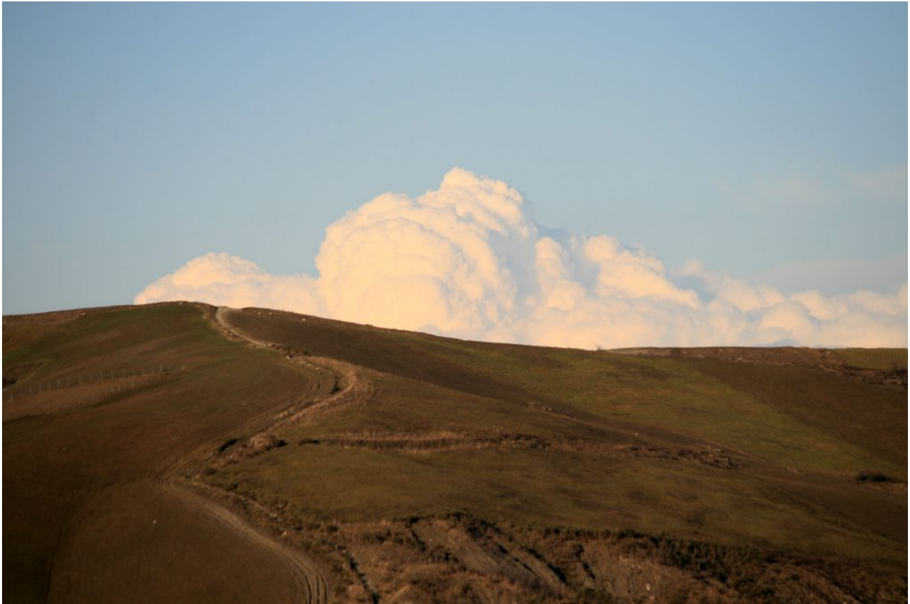
Costa del Vento in February

Setters running in wide open plains, setters used in woods, or among briars and bushes, were doing well, proving to be a quite versatile and adaptable breed but, my gut feelings kept telling me something was still out of place. I had old pictures of setters on the moor in my books and on my walls, they were black and white pictures and I could not figure out the colours. In 2008, at the CLA Gamefair, I purchased the GWT (Gamekeepers Welfare Trust) Ladies & Gamekeepers Calendar: the moor was shining in purple! It was not just the heather: the sky and the light were coming in different shades of violet, the whole atmosphere was purple! It was so surreal, so magic! I thought the colours had been recreated using Photoshop. I can be pretty naïve sometimes!