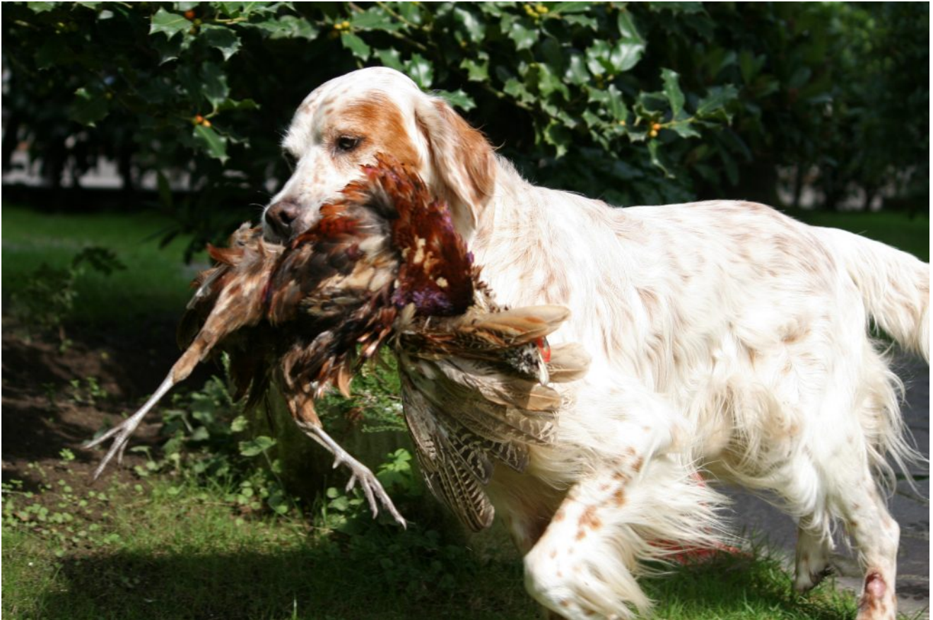
Socks at 13 years old retrieving a pheasant