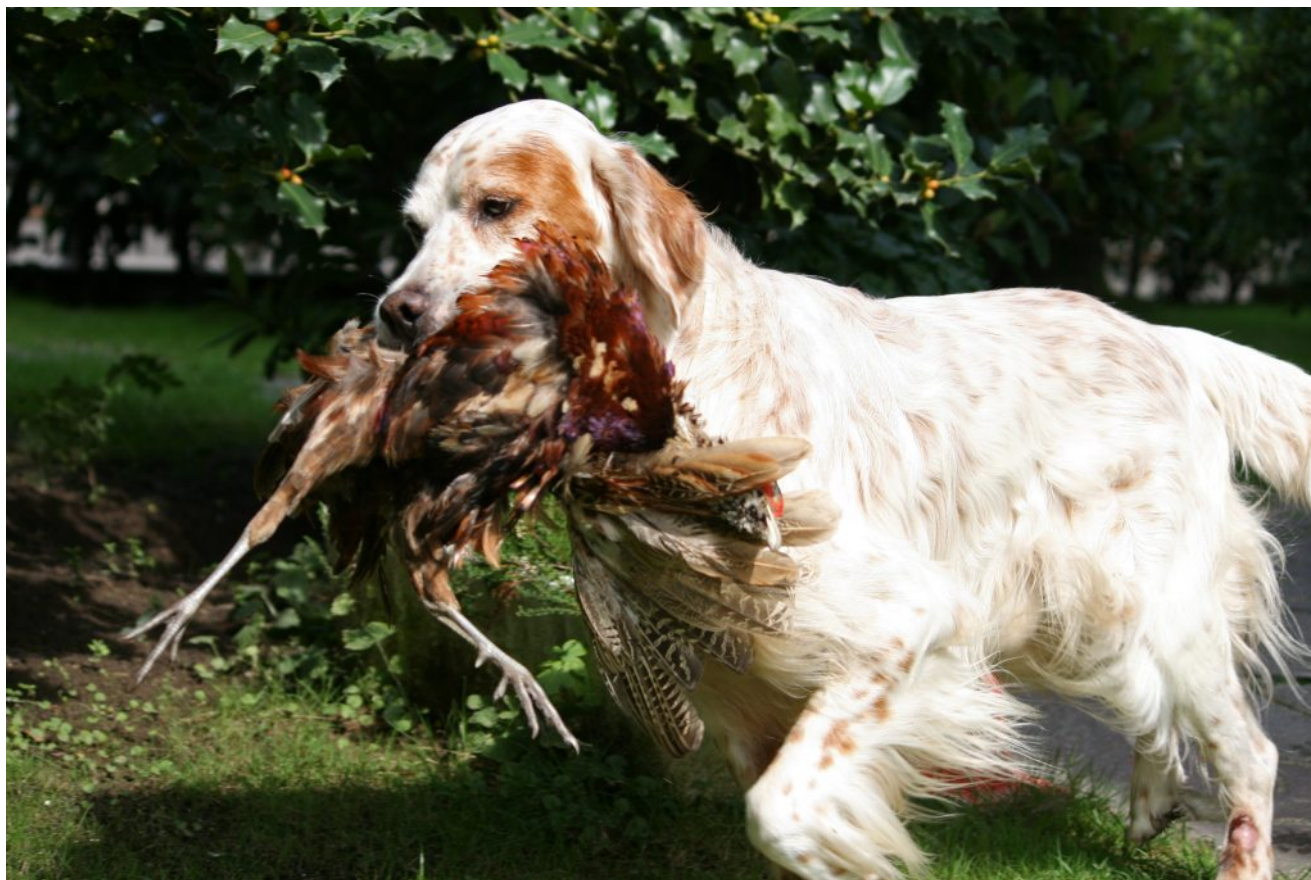
Socks a 13 anni riporta un fagiano

che, FORSE, permettergli di fare ciò per cui era nato gli avrebbe consentito di superare alcune sue paure.