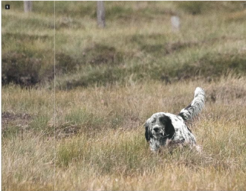
1 Upperwood Forest di Dom Goutche in ferma su grousse e Yod Moss