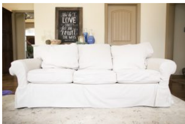
Quasi uguale a quello dell'Avanella

con le cugine se ho rubato l'ambito catalogo per anni, a loro insaputa, ma bisogna pure arrangiarsi. Il catalogo Ikea incarna quello che rappresentava il catalogo Postalmaket nella mia infanzia: in pratica guardi tutto, vorresti comprare tutto, e poi non compri nulla. O, in alternativa, vai in fissa, guidi fino all'Ikea, perlustri per ore e poi ti accorgi di non riuscire nemmeno a sollevare dagli scaffali quello che vorresti caricarti in macchina e portarti in casa.