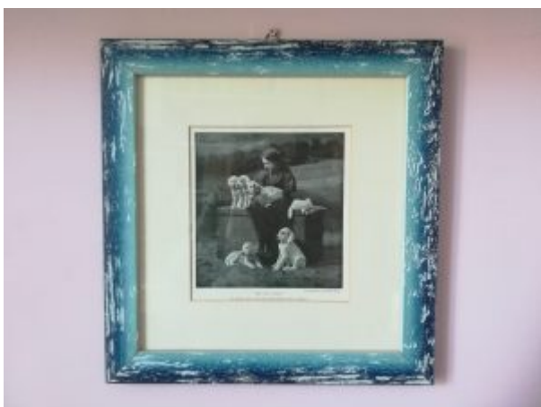
We are Seven

Scottish Deerhounds on the Hills of the Vicinity of Edinburgh " (un branco di deerhound scozzesi sulle colline nei pressi di Edinburgo), mi pare un po' tirato. Avete presente che cos'è un deerhound? Se non lo sapete ve lo spiego io: i deerhound sono dei levrieri specializzati nella caccia al cervo. La traduzione letterale del loro nome è segugi da cervo. Sono alti, molto alti sugli arti, smilzi, grigiastri e hanno un mantello duro, arruffato che spara in ogni direzione. Siccome so che è scortese paragonarli allo scopettone del wc, dirò che assomigliano a quelle spazzole irsute e avvitate che si usano per lavare l'interno delle bottiglie. Tolto il paragone politicamente scorretto, a me piacciono persino ma... non hanno nulla a vedere con le bestiole che appaiono nella foto. Abbiamo invece otto, forse nove – c'è una testolina che spunta dietro – cani. Di questi, quattro sono setter inglesi, tre sono pointer inglesi e uno sembra essere un cocker, per non sbagliare chiamiamolo semplicemente spaniel. I cani sono più o meno accovacciati e fermi, a dimostrazione che la steadiness (capacità di restare immobili), non è stata scoperta di recente dagli addestratori scozzesi. Dietro sembra vedersi un lago, più in là la sagoma dei moor .