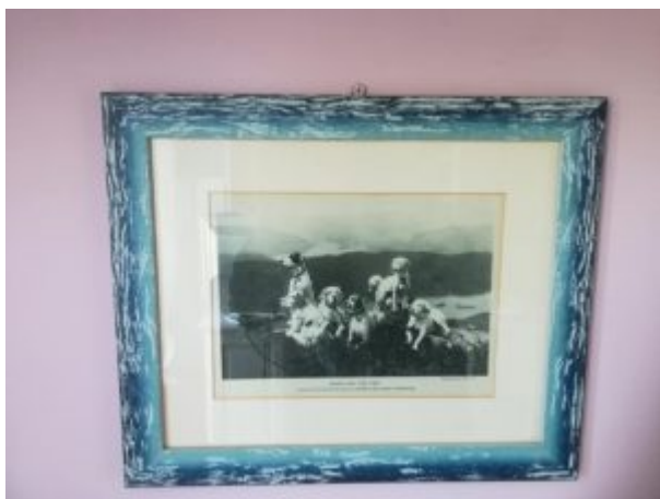
Ready for the Call

passpartout centrale è più crema degli altri, che danno invece sul corda? Chi lo sa, ho impattato con l'ennesimo buco del gruviera. Nell'anno di nascita delle cornici blu non esistevano ancora i tutorial su Youtube, però avrei potuto aggrapparmi ai ricordi delle lezioni di educazione tecnica delle scuole medie. Ci ho pensato, ma non ci ho neanche provato: è inutile cercare di fare il salto dalla teoria alla pratica, se sai già che quanto allungherai la gamba cadrai prima di toccare l'altra sponda.