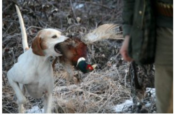
Pointer inglese riporta

ISTINTO: facoltà di conoscere un oggetto o una situazione senza la mediazione del ragionamento; perspicacia, acume, assoggettato alle identità di razza.