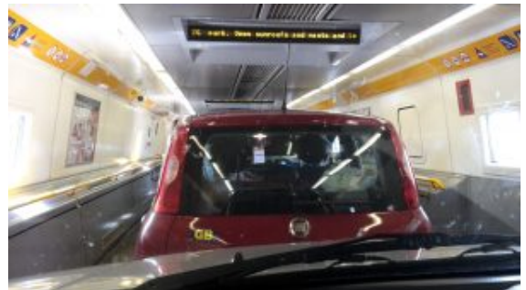
Inside the tunnel

late: I was told it takes time to go through the Pet Reception Area. The motorway was, again, virtually empty and the sun was casting dull grey rays. Why the tunnel? As I have always reached England by air, I wanted to reach it by sea to see the "White Cliffs of Dover" (school memories) hence the ferry was an interesting option until I found out that pets must remain in the car. Here in Italy, the opposite happens: you CAN'T leave a dog in a vehicle on a ferry. You are not supposed to do so because it is deemed too dangerous, and rightly so: I know of dogs, illegally left there, who were found dead, probably killed by gas exhalations. Our ferries provide kennels for dogs but you are also allowed to keep the dog with you. British Ferries, instead, follow another policy and dogs must be left in the car: whereas it is true that the trip is quite short, during the summer months temperatures could be too high. Indeed, I investigated and it came out that some pets had died, while crossing from France to England in the summer, cause of death was heatstroke. This is how I made my decision.