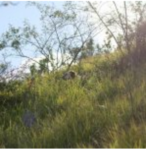
Briony pointing three pheasants