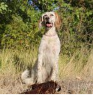
Hello, my name is Briony and I am a happy dog :-)