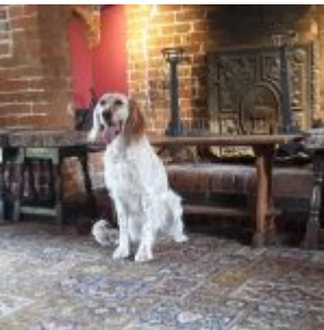
Briony likes pubs