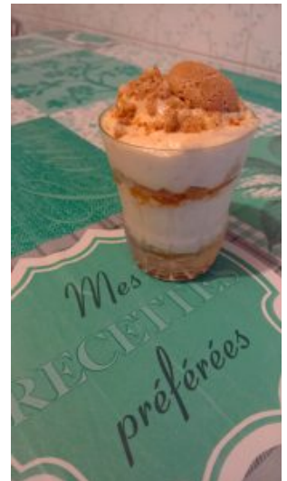
Coppa all'amaretto – I dolci di Flavia

Montate gli albumi a neve e tenere da parte. Montate i tuorli con lo zucchero finché non diventano chiari e spumosi. Incorporate il mascarpone gradualmente, facendo attenzione ai grumi. Unite quindi il liquore e circa 70g di amaretti sbriciolati grossolanamente. Infine, incorporate con movimenti dal basso verso l'alto gli albumi per non smontarli.