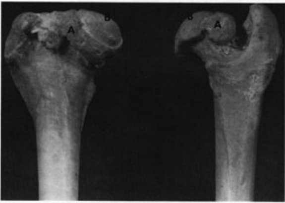
FIG. 83-14 The proximal ends of two femora illustrate the effects of advanced hip dysplasia. New-bone formation (exostoses) encircles the femoral necks at the junction of the head and neck (A). The femoral heads are shortened from wear and the cartilage surfaces are eroded and eburnated (B). (Reproduced with permission from Riser WH: The dysplastic hip joint: Its radiographic and histologic development. JAVRS 14:35, 1973)

cartilagine è stata erosa. Possono formarsi